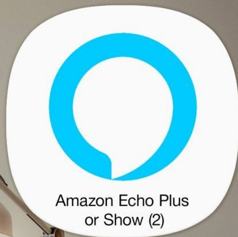
Amazon Echo Plus or Show (2)